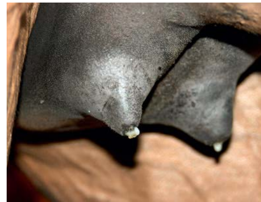
OBEN | Harztropfen und prall gefüllte, glänzende Zitzen sind Anzeichen einer bevorstehenden Geburt.

schnelle Fruchttod bzw. die gesteigerte Gefahr von vaginalen Verletzungen. Aus diesem Grund ist eine Geburtsstörung beim Pferd immer ein Notfall. Verschiedene Systeme wie eingenähte Sender, die auf Dehnung des weichen Geburtswegs basieren, oder befestigte Gurte bzw. Halfter, die auf Positions- und Leitfähigkeitsänderungen reagieren, sollen auf den kritischen Zeitpunkt der Geburt aufmerksam machen. Jedes Verfahren hat Vor- und Nachteile und ist abhängig von der persönlichen Erfahrung der Anwender. Jedoch können Fohlenverluste entweder durch die moderne Technik oder ständiger Wachsamkeit in der Austreibungsphase erfolgreich reduziert werden.